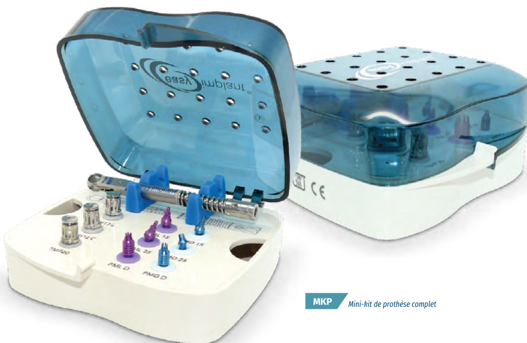
MKP Mini-kit de prothèse complet